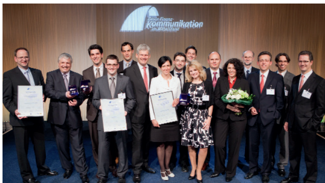
Zurecht stolz: die Sieger des Finanz-Kommunikations-Awards 2009